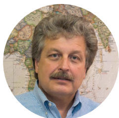
Сергей Рахуба Президент Миссия Евразия

Государственный департамент США, USCIRF и Совет Европы, должны принять решительные меры для устранения перечисленных ниже системных нарушений и защиты тех, кто страдает от этого репрессивного режима.